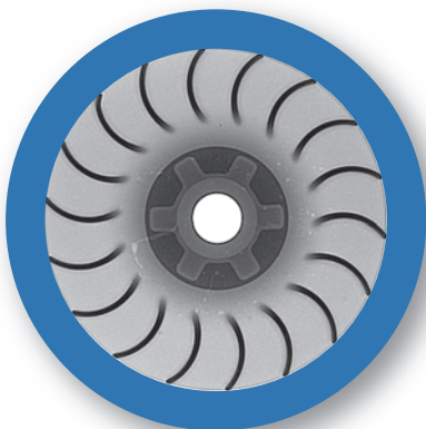
アルミダイカスト (ボイド、クラック検出)